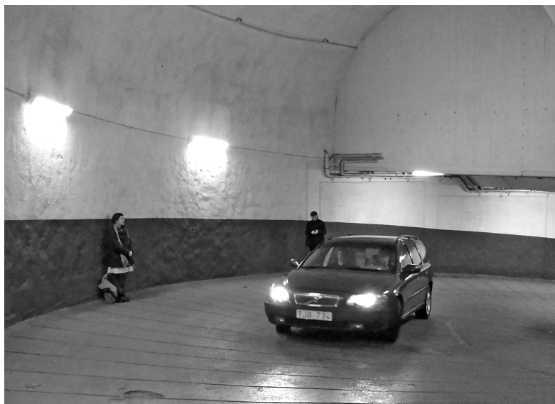
Figur 4. Hur resonerar man med ett parkeringshus?

radikalt – det blir torrare, kortare och ödsligare. Raderna med bilar glesas ut och ett dammigt övertäckt bilvrak ger en känsla av att man befinner sig på en övergiven plats. Rösten räcker inte långt i våra försök att få kontakt och vi måste ta till andra medel: vi klampar, knackar i rör och gnisslar på en fiol. Avstånden och ödsligheten förstärks i det starka lysrörsskenet. Rummet svarar inte an mot våra ansträngningar; när vi sjunger, ropar, knackar, stampar blir var och en isolerad i sin egen ljudvärld tills vi tystnar och inväntar ett svar, en svag röst eller knackning långt bort (film 1, figur 4). Det är denna ödsliga resonans i parkeringshus, flitigt utnyttjad i film, som gör att den hotade huvudpersonen enbart hör sina egna fotsteg och sitt eget hjärta slå. Paradoxalt nog spelas ofta klassisk musik i parkeringshus för att inge en slags trygghet och samtidigt hålla hemlösa borta.