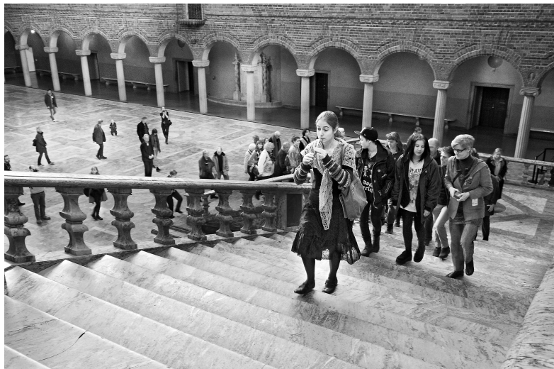
Figur 5. Råttfångaren i stadshuset: vandring genom ljudrum.

igenom alla rum för att utveckla en medvetenhet om skillnader och förändringar i klanger, ekon, resonans (film 3). Till sist beslutade vi att tillsammans med en amatörgrupp av blockflöjtsblåsare, från bastill piccolaflöjter, genomföra ett par turistvandringar med betoning på ljudmiljö och resonans. Med början i Blå hallen ombads publiken att blunda för att ställa om sin perception från det visuella mot det hörbara och ett intensivt lyssnande tog sin början.